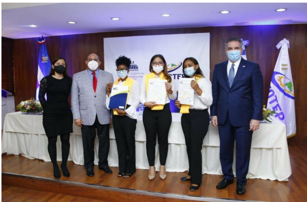
Imagen 3 Entrega de certificados INFOTEP-PROPEEP. 24 de noviembre del 2020

Durante este año 2020, a raíz del impacto de la Pandemia del Covid-19 se adecuaron los contenidos y actividades migrándolos a la Modalidad Virtual, este proceso en coordinación con el equipo técnico del INFOTEP ha permitido dar continuidad con éxito al desarrollo del curso. Implicó la capacitación de todos los docentes del curso técnico (15) en metodología virtual, se adaptaron las herramientas y metodología pedagógicas, se hicieron los aprestos en DIGEPEP (hoy PROPEEP) para la difusión por redes sociales del curso y se logró contar con una preinscripción de más de 200 personas para julio de 2020 lo que permitió iniciar en agosto de 2020 con tres grupos de 25 personas en simultáneo.