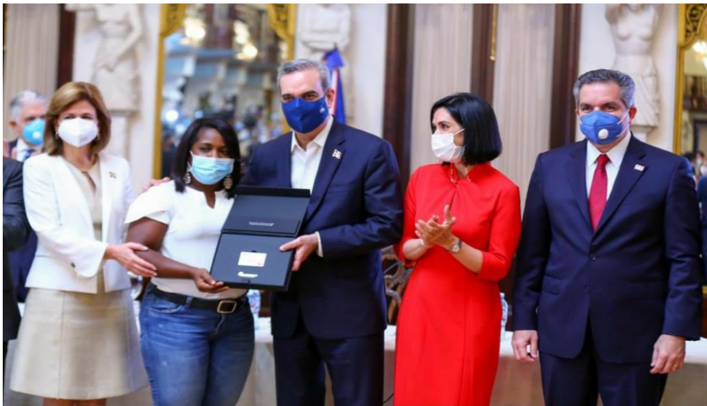
Imagen 5 Entrega tarjeta representativa de “La navidad del cambio”