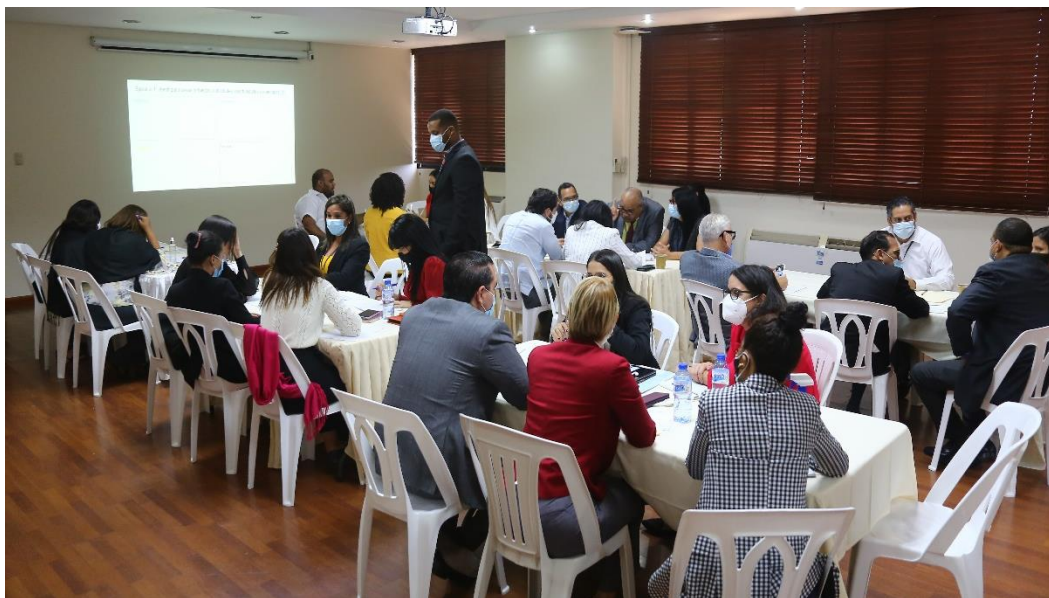
Imagen 6 Taller de planificación estratégica. 21 de diciembre del 2020

Para febrero 2020 se espera concluir el proceso de formulación del Plan Estratégico Institucional para el periodo 2021-2024, cuyo diagnóstico se inició a finales del mes de noviembre del 2020 y en diciembre el primer taller de trabajo para revisar y validar los resultados del diagnóstico, con la participación del directivos, encargados y personal técnico de la institución.