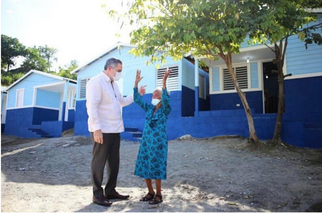
Imagen 4 El Ministro Nene Cabrera hace entrega de una vivienda digna en el marco del Plan Quisqueya Digna.