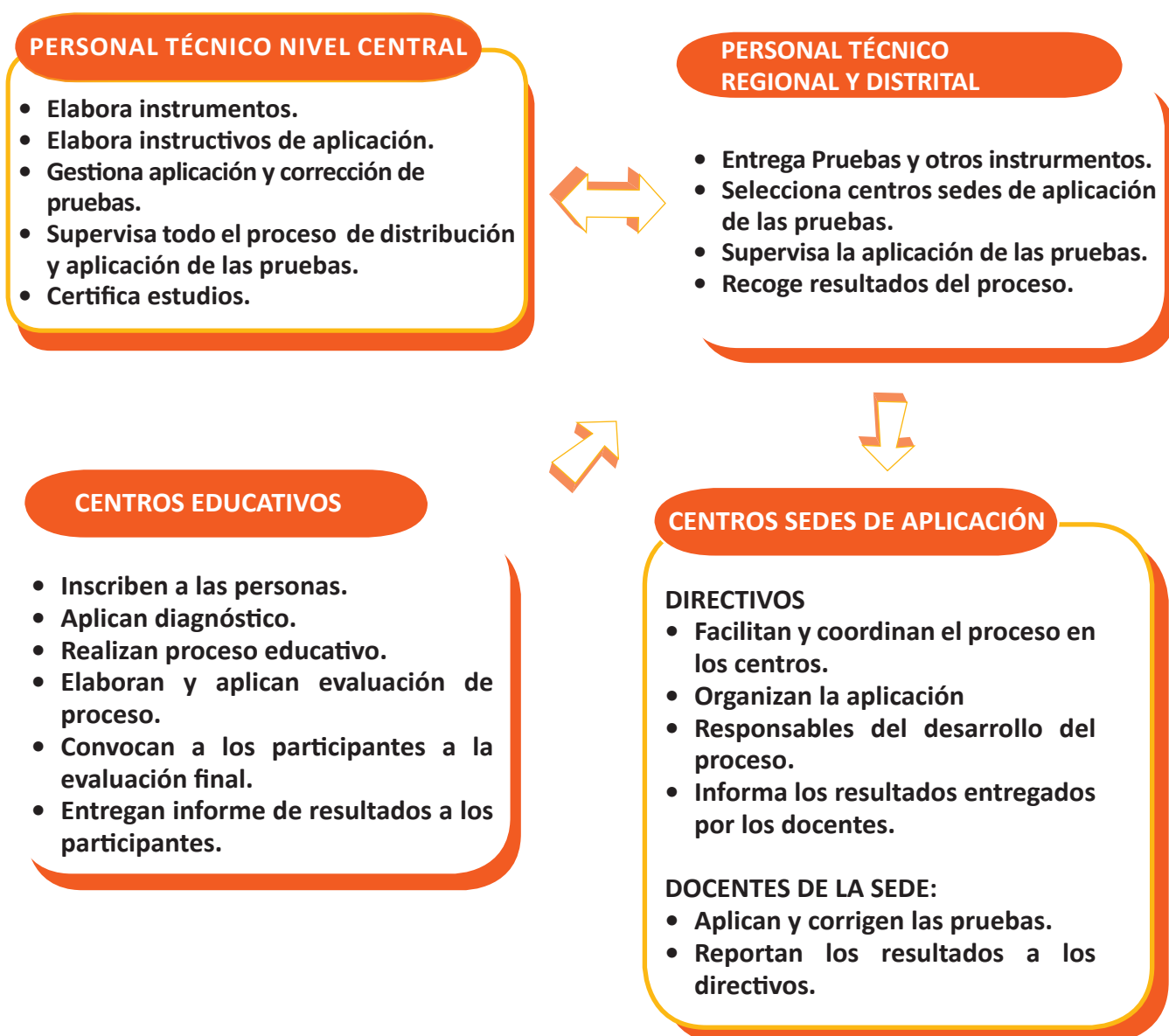
Gráfico N° 3: Actores y sus Funciones

Sobre la base de este flujo organizacional, en mayo de 2012, la Dirección General de Educación de Jóvenes y Adultos, Asesores Nacionales y Regionales de Pruebas Nacionales, Técnicos Distritales, Directores de Centros Educativos de Jóvenes y Adultos y Docentes del Primer Ciclo de Educación Básica de EDPJA, implementaron una aplicación piloto de las pruebas diagnósticas correspondientes al Primer Ciclo de Educación Básica. Los resultados de esta aplicación, entregaron valiosa información que permitió validar y ajustar el procedimiento 7 .