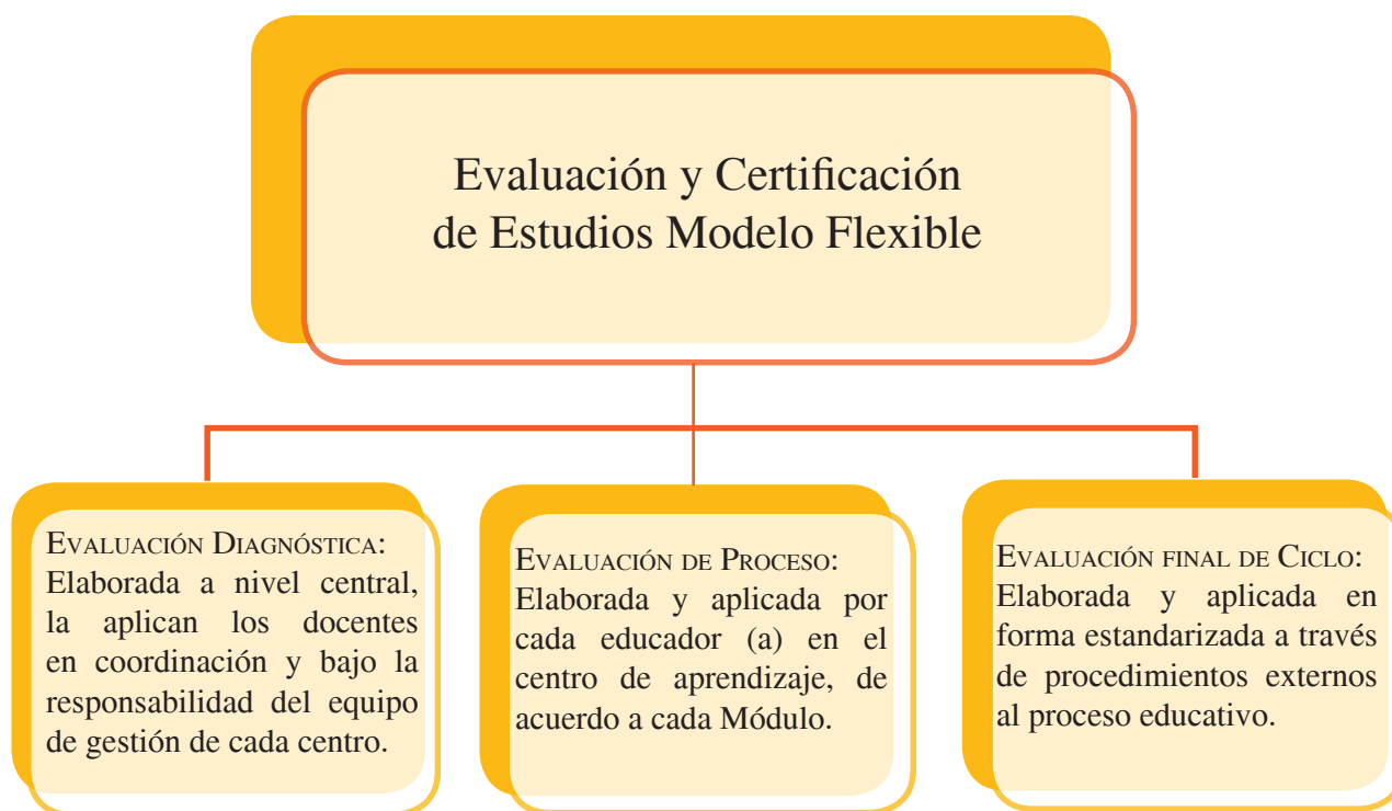
Gráfico N° 2: Modelo Flexible y Sistema de Evaluación de los Aprendizajes para la Educación de Personas Jóvenes y Adultas.

En síntesis, la evaluación diagnóstica permitirá distinguir el módulo de ingreso de las y los participantes en cada uno de los ciclos, la evaluación de proceso permitirá al educador(a)/ facilitador(a) dar seguimiento a los aprendizajes de los participantes en las sesiones presenciales en los centros y/o espacios de aprendizajes y la evaluación final conducirá a la certificación del ciclo.