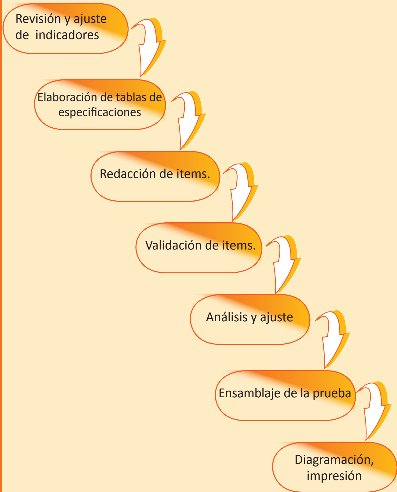
Gráfico N°4: Procedimiento de elaboración de instrumentos.

En el diagrama siguiente, se grafica el proceso de elaboración de instrumentos.