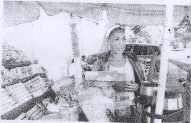
Las mujeres presentan una menor participación laboral.

De acuerdo con un análisis del mercado laboral dominicano que abarca desde el tercer trimestre de 2019 hasta el tercer trimestre de 2022, las mujeres han recuperado sus empleos más lentamente que los hombres, quedando unas 6,925 mujeres sin puestos de trabajo tras la pandemia del Covid-19.